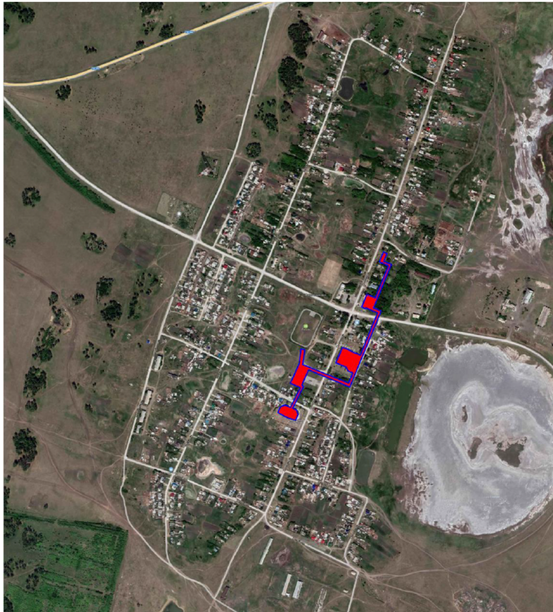
Рисунок 1.1 – Существующие зоны действия источников теплоснабжения на территории поселка Новопокровка