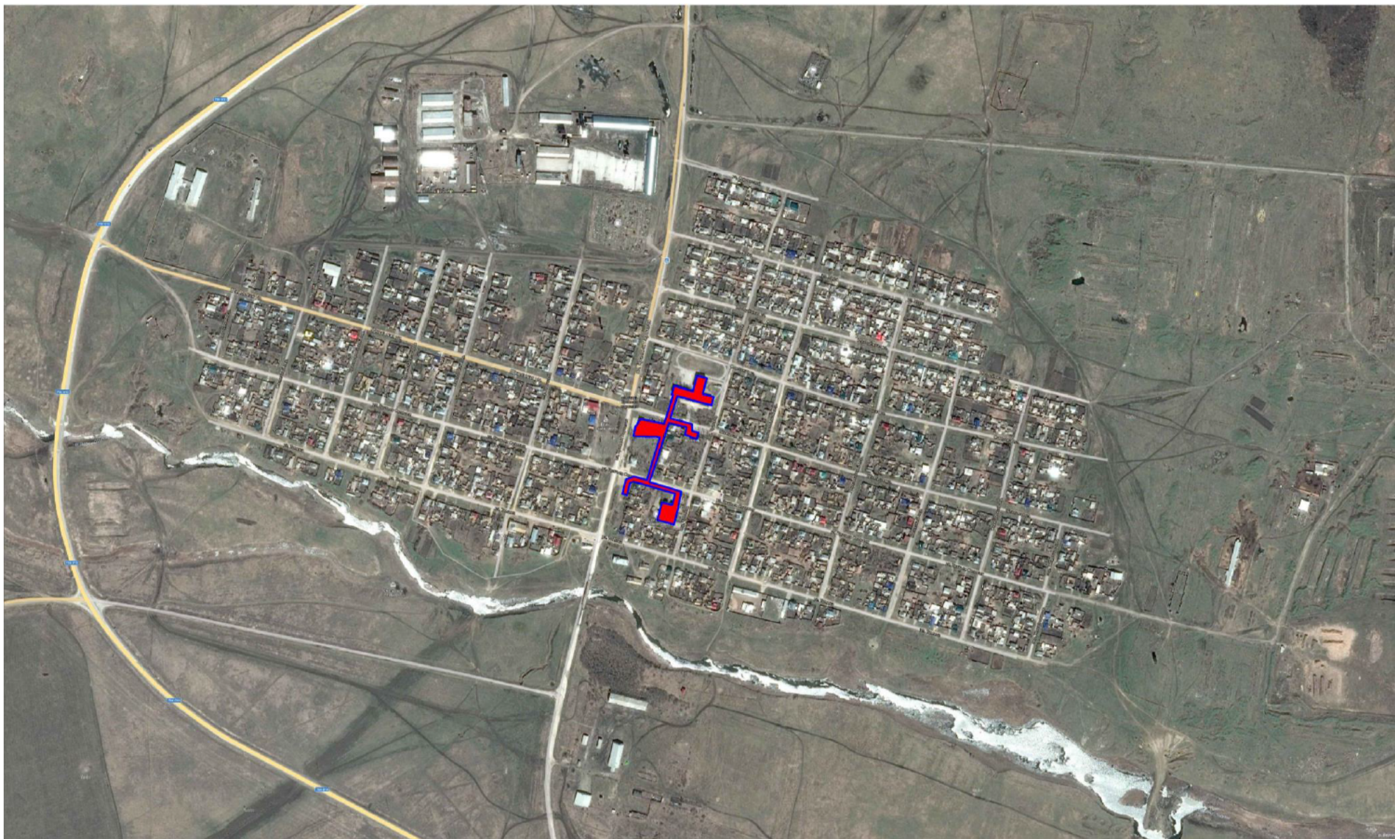
Рисунок 1.2 – Перспективные зоны действия источников теплоснабжения на территории села Бородиновка