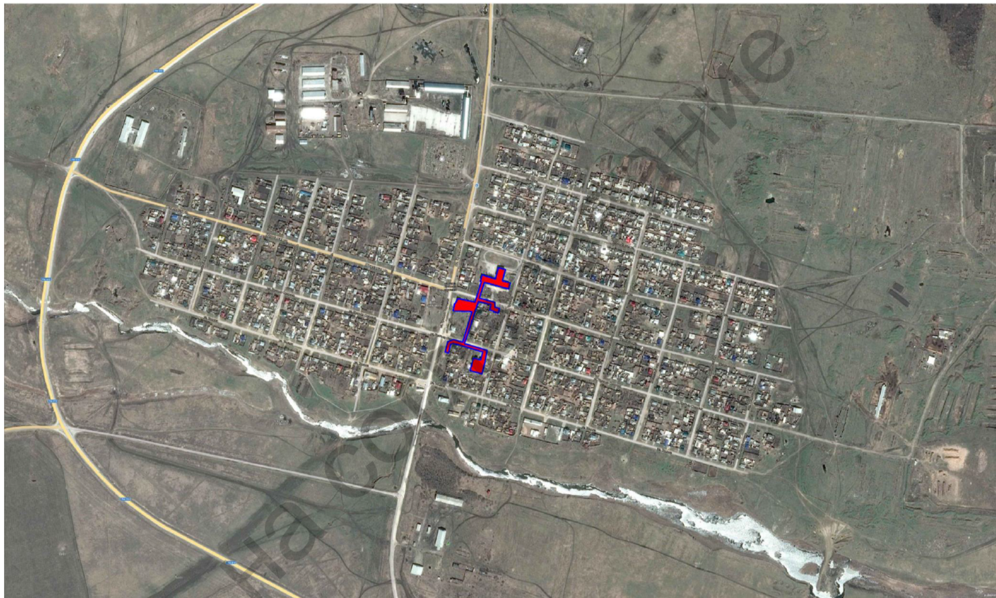
Рисунок 1.2 – Перспективные зоны действия источников теплоснабжения на территории села Бородиновка