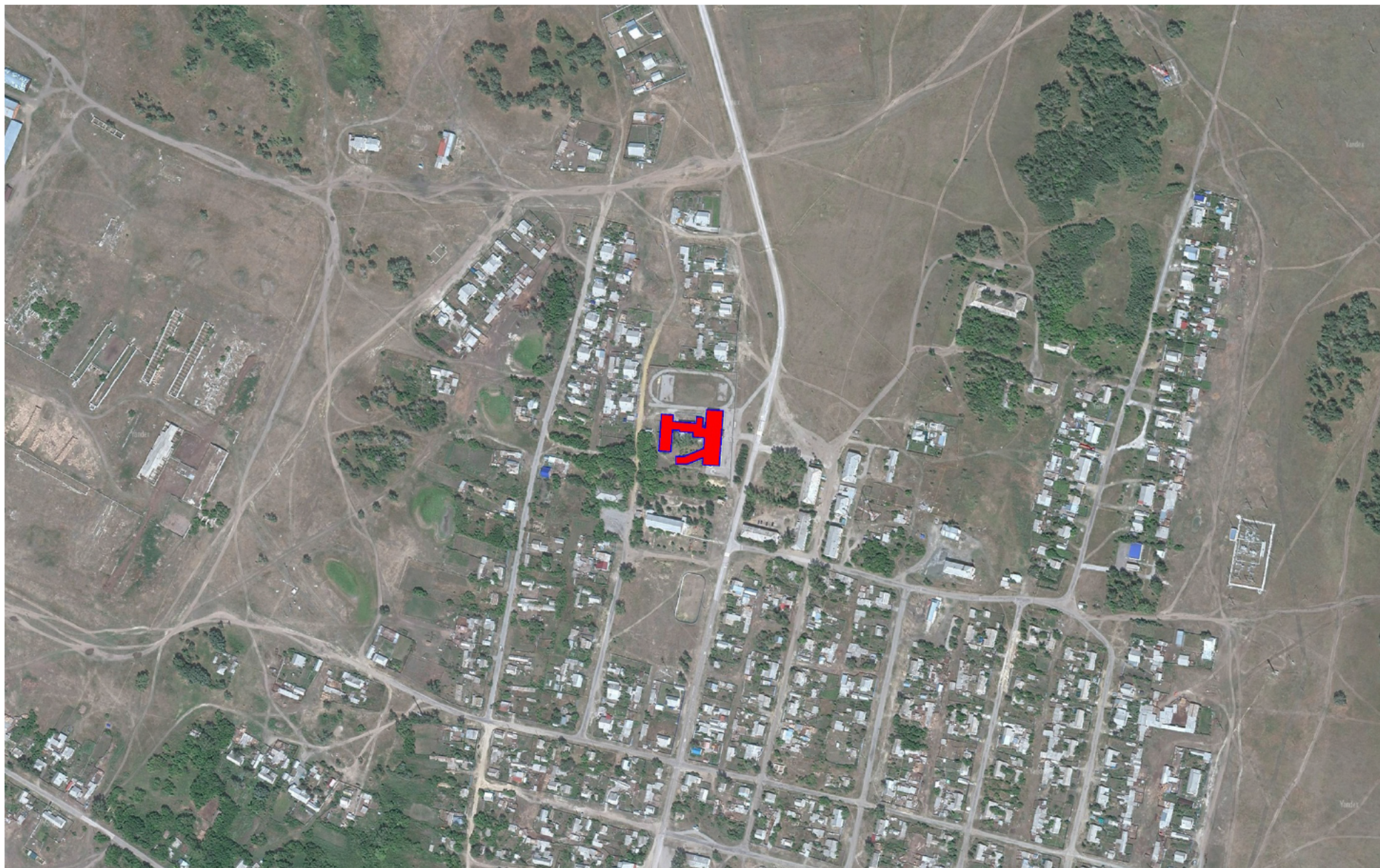
Рисунок 1.1 – Существующие зоны действия источников теплоснабжения на территории села Арчаглы-Аят