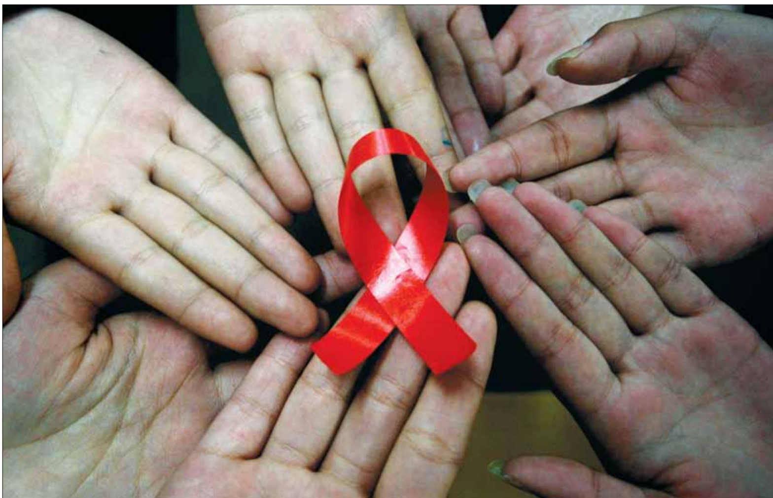
Каждый седьмой житель Европы не знает о том, что является носителем ВИЧ-инфекции.