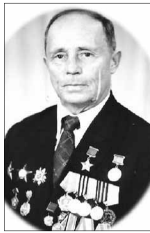
Школа носит имя Героя Советского Союза — М. Г. Русанова

30 ноября 1971 года на окраине села построили новое здание школы на 960 мест, в котором до сих пор получают знания юные варненцы. Вокруг раскинулся пустырь, в окнах был виден лес, а до горизонта простиралась бесконечная степь.