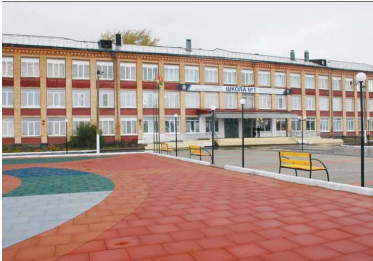
В 2016 году территория школы №1 преобразилась