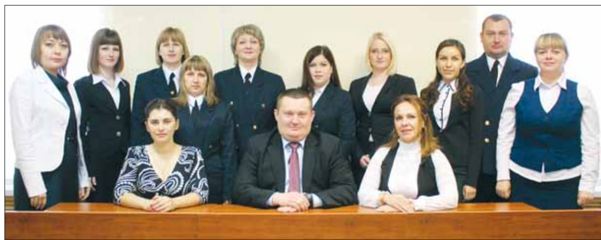
Коллектив Варненского районного суда 2016 года.

80 лет — много это или мало? Для отдельного человека — это целая жизнь, а для школы лишь небольшая часть её истории. Коллектив «первой» уверенно смотрит в будущее и способен решать все задачи, которые ставятся перед ним. По-другому нельзя: ведь пока живёт школа — живёт село, пока живо село — живёт Россия.