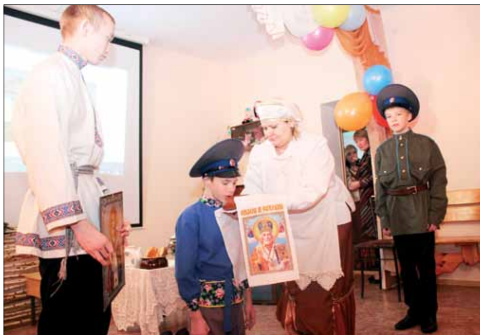
Воспитанники Центра подготовили для гостей небольшое театрализованное представление.

После долгих размышлений в коллективе пришли к выводу, что индивидуальные кухни в семьях необходимы. Общими усилиями провели в здании ремонт, оборудовали комнаты закупили соответствующую мебель, посуду, бытовую технику. Теперь дети питаются не в общей столовой, а имеют возможность в любое время разогреть обед или