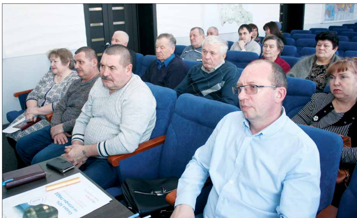
Общественная палата призвана обеспечить защиту прав и свобод граждан.

Постановлением администрации от 5 декабря 2016 года было утверждено Положение об общественной палате Вар-