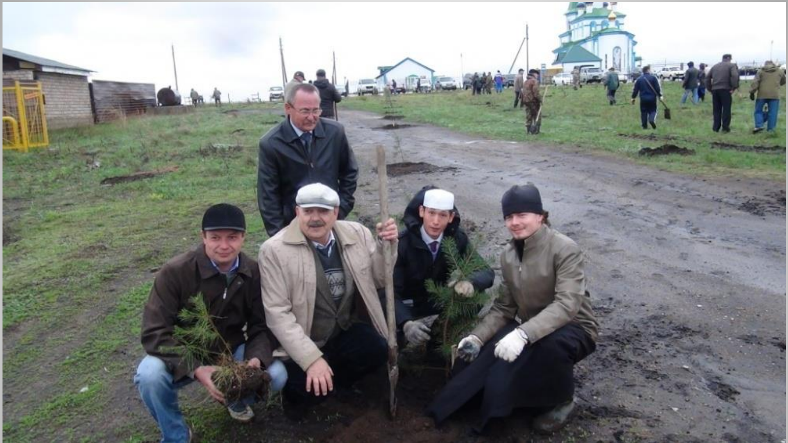
Благоустройство территории возле Храма