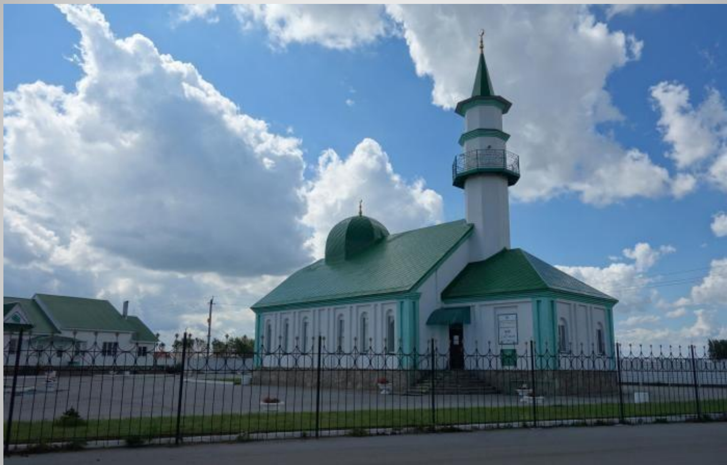
Мечеть «Нур» в Варне